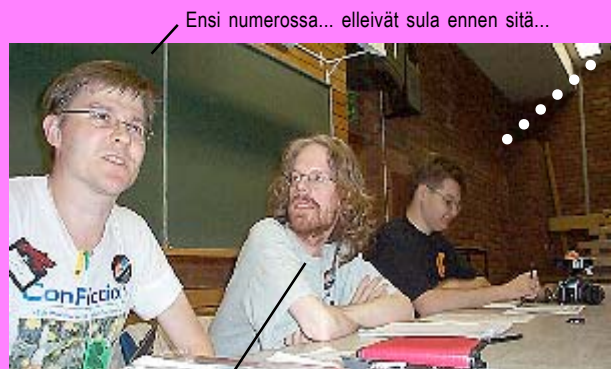
Ensi numerossa... elleivät sula ennen sitä...

Johanna Sinisalo: Nyt on historiallinen tilanne, jossa fantasiakirjoja myydään kuin näkkileipää, ja niitä jonotetaan kirjakaupoissa. En ole itse lukenut kirjoja, paitsi Potteria. Niiden juonet ovat kuitenkin aika klassisia: minulla on korkea, salainen syntyperä, ja tietenkin salaisia voimia jne. Se ei vaadi älyllistä ponnistelua.