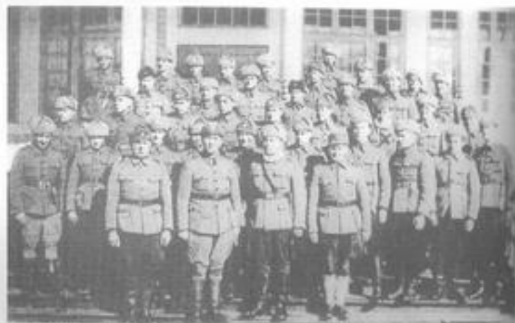
Osasto Sisun virolaiset vapaaehtoiset Lapualla 1940.

Toukokuun 18. päivänä virolaiset pääsivät Hammerfestin ja Tromsön kautta Narvikin rintamalle ja siellä