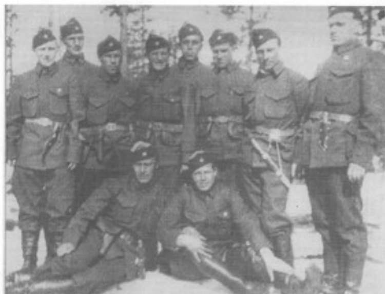
Virolaiset vapaaehtoiset Narvikissa keväällä 1940.